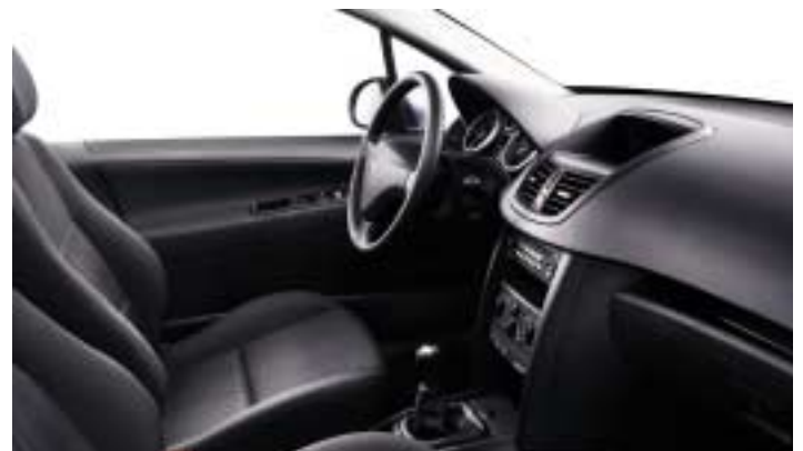
Tkanina Koulikoro Tempete siva. Gornja dekoracija komandne ploče Mistral crna. Autoradio RD4 u opciji