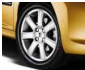
Alumijski naplatak Spa 16"