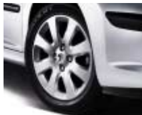
Ukrasni poklopac Hobart 15"