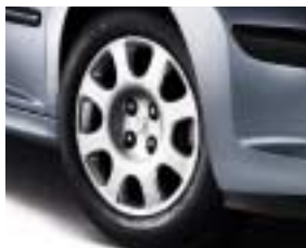
Ukrasni poklopac Auckland 15"