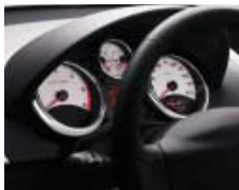
Instrument ploča Sport