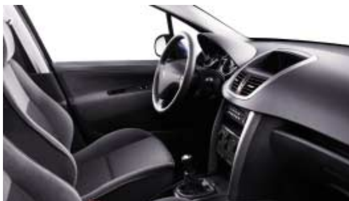
Tkanina Chirongui Siva. Gornja dekoracija komandne ploče Ondine siva.