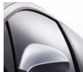
Kromirana kućišta retrovizora

Prednja i stražnja školjkasta sjedala koja pružaju odlično bočno držanje, Alcantara® na sjedalima i oblogama vratiju prošivena bijelim vezom, upravljač presvučen kožom, ukrasi u kromu, svi detalji unutrašnjosti naglašavaju njegov sportski karakter.