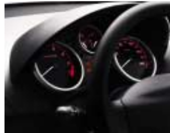
Instrument ploča Urban