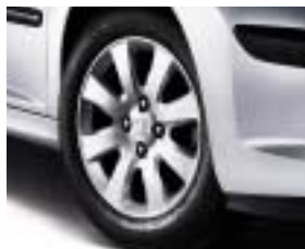
Ukrasni poklopac Perth 16"