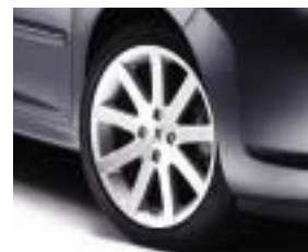
Alumijski naplatak Pitlane 17"