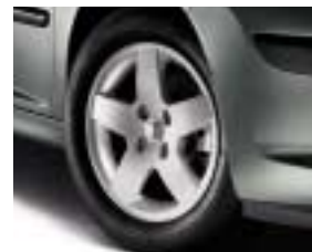
Alumijski naplatak Monaco 15"