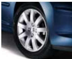
Alumijski naplatak Estoril 16"