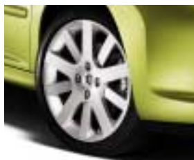
Alu. naplatak Hockenheim 17"