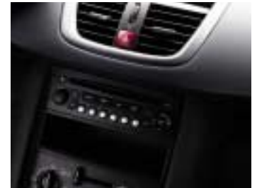
Radio CD RD4