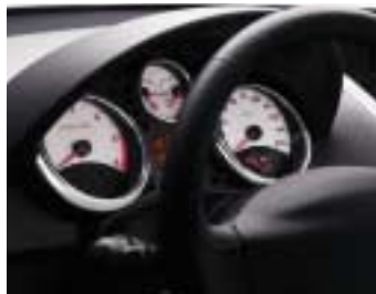
Instrument ploča GT