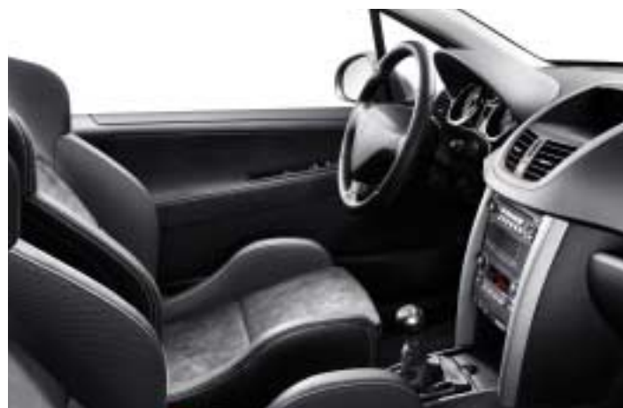
Školjkasta sjedala obložena u Alcantaru®