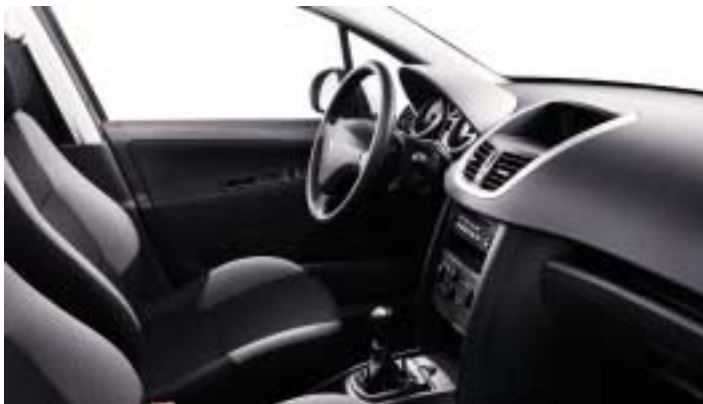
Opletana tkanina Pachinko Crna. Gornja dekoracija komandne ploče Mistral crna.