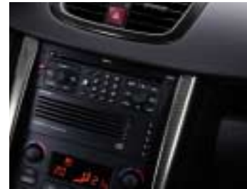
Dekoracija komandne ploče Gordon