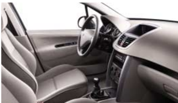
Tkanina Chirongui Grege. Gornja dekoracija komandne ploče Ondine siva.