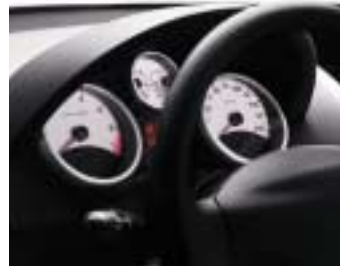
Instrument ploča Trendy