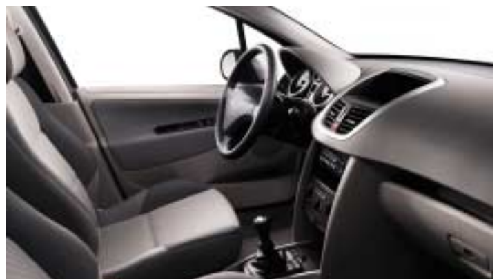
Opletana tkanina Pachinko Grege. Gornja dekoracija komandne ploče Grege.