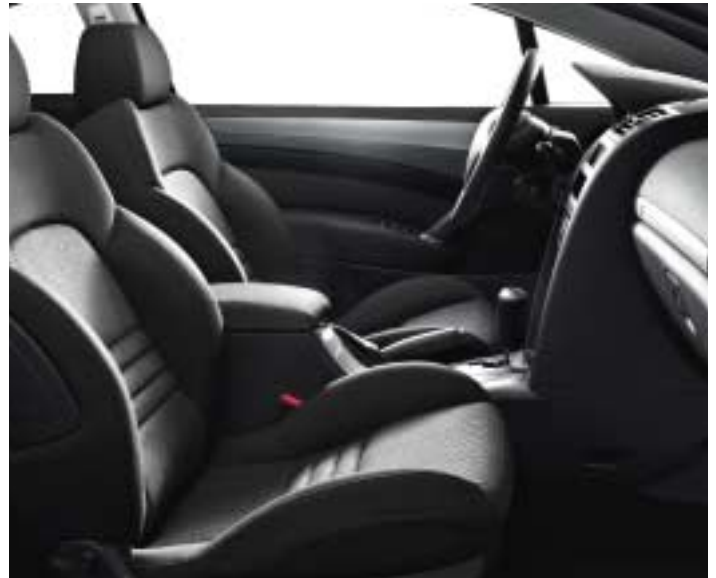
Crna tkanina Speed Up