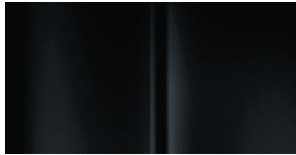
Crna Perla Nera