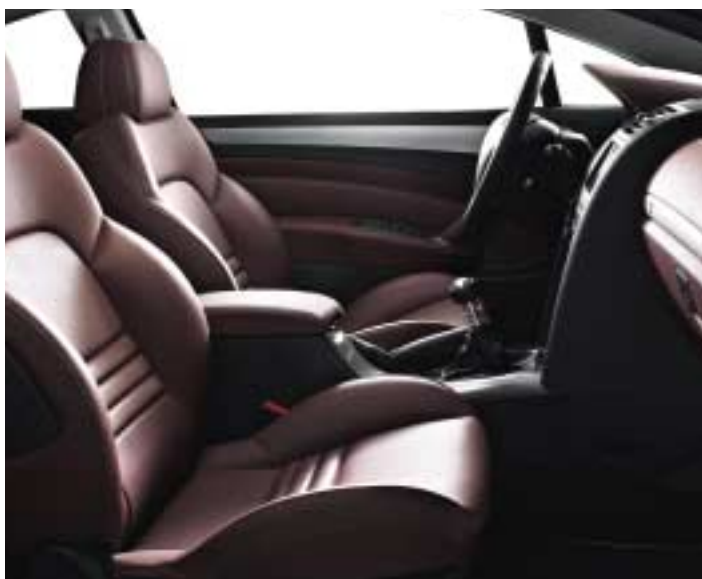
Koža* Cerbere (model prikazan s opcijom integralna koža**)