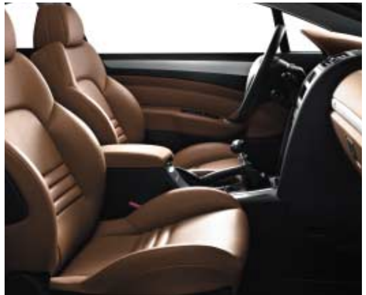
Koža* Palimbro (model prikazan s opcijom integralna koža**)