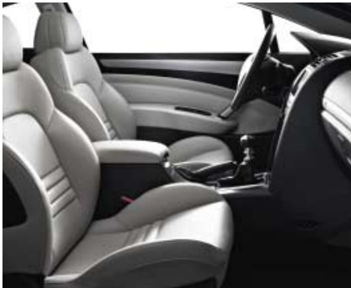
Koža* Lama (model prikazan s opcijom integralna koža**)