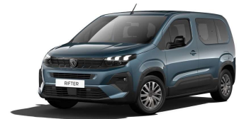
M6M0 - PLAVA KIAMA