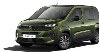
4QM0 - ZELENA SIRKKA