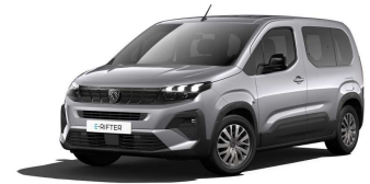
F4M0 - SIVA ARTENSE