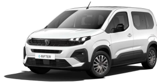
PRP0 - BIJELA ICY