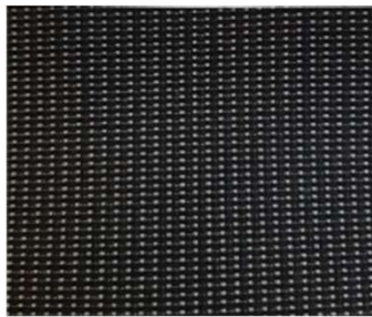
CMFY - Tkanina "Sixties"

• = Unutrašnjost u seriji o = Unutrašnjost u opciji