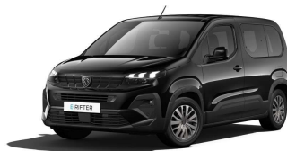
9VM0 - CRNA PERLA NERA